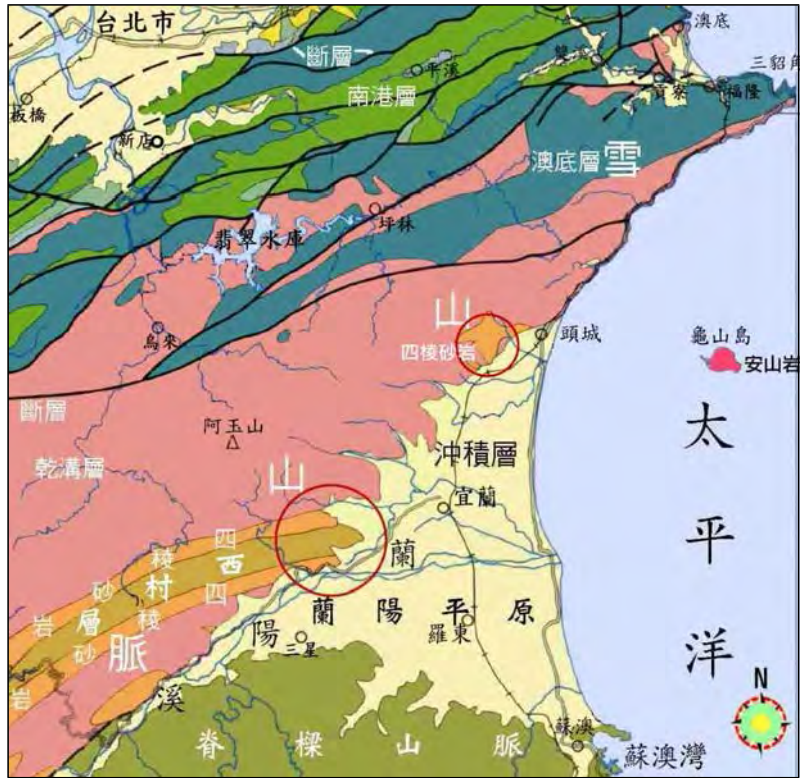
圖 3 台灣東北角附近地質圖

一般人認為蘭陽平原是由蘭陽溪帶來的沖積物堆積而成，但是從中央地質調查所的水文地質調查研究資料透露，蘭陽平原接近中央的沖積層最厚，反而接近出海口的沖積層較薄，與一般的沖積平原愈接近出海口愈厚的現象相違背(陳文山, 2000)，顯示蘭陽平原不是由蘭陽溪所沖刷的泥沙堆積而成的沖積平原。另外在蘭陽平原的中央部分，正是堅硬的雪山山脈西村層和四稜沙岩的聚合岩脈延伸線上，應仍是岩脈構造，竟然成為沖積層最厚的部分，這些現象顯示蘭陽平原並非蘭陽溪的沖積平原，而是由雪山山脈崩落的砂石所造成的。