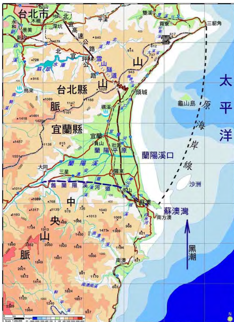
圖 1 台灣東北角附近地形圖

2001 年 4 月底，國際共同參與的海洋鑽探船「聯合果敢號」在台灣東北海域進行海洋鑽探計畫 (ODP)1202 站的作業。在龜山島東方約 75 公里處的南沖繩海槽南坡(圖 2)，即宜蘭海脊北坡、水深 1,275 公尺處，鑽取四口岩心，其中最深一口深入海底地層 410 公尺。由鑽取的岩心，氧同位素研究綜合紀錄中，其沉積率估算約為每千年 500 公分(Wei, Mii, & Huang, 2005)，一般海底沉積率平均才有 3-5 公分而已，我們可以發現此處沉積率是世界最高的區域。