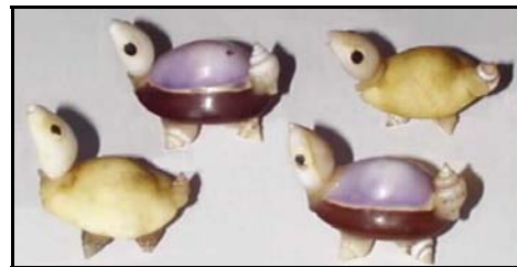
野柳海濱風景區的龜螺