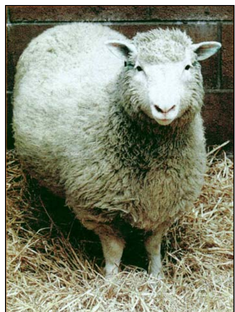
複製羊「桃莉」滿周歲

雷爾的說法，與目前人類所知的事實仍有出入。況且雷爾發表的言論，均僅屬他單獨個人經驗的敘述，並沒有實際的證據或其他目擊者證實，因此也不