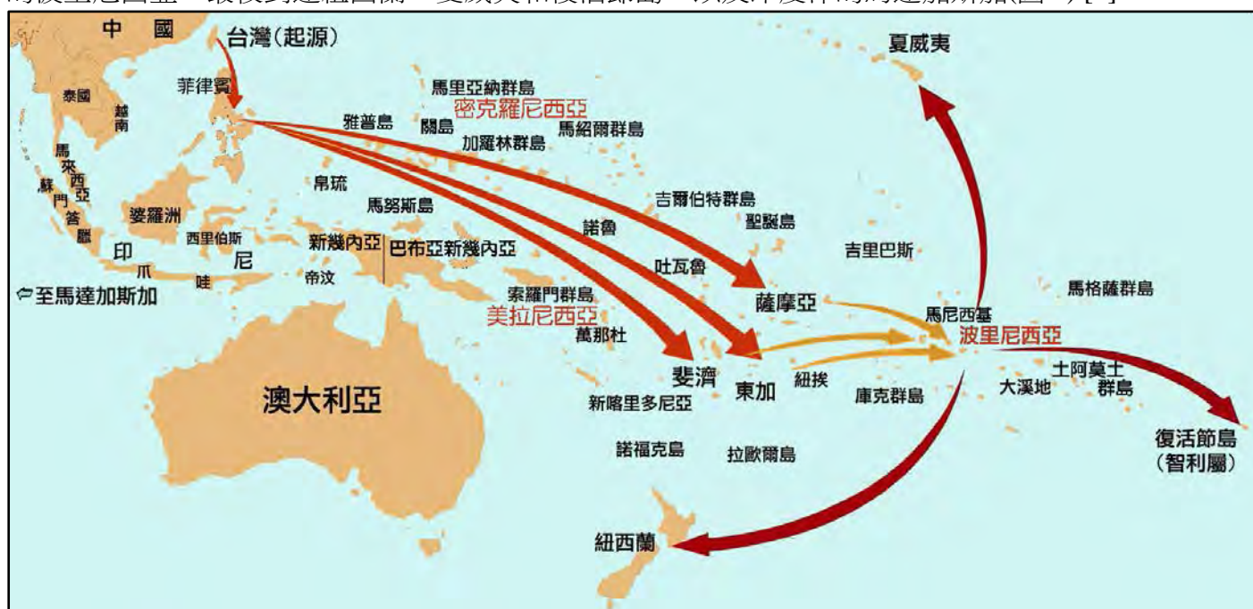
圖 2 南島語族 5500 年來遷徙之旅

二〇〇九年一月紐西蘭奧克蘭(Auckland)大學心理學家葛雷(Russell Gray)教授在「科學」期刊發表的最新區域語言研究，他利用電腦分析東南亞與太平洋地區的四百種南島語系語言的 210 個基本字彙，像是動物名稱、簡單的動詞、顏色和數字，可以追溯語言的演進過程。由這些語言之間的關係，建立語言世系拓樸圖(Language Tree Topology)，提供詳細的太平洋民族遷徙史，證實當今的波里尼西亞人源於台灣，他們約於五千五百年前從台灣出發，遷徙至菲律賓，經過擴張潮(Expansion Pulse)和定居期(Settlement Pause)，然後在一千二百年內快速遷往太平洋，從菲律賓向外散居於廣達七千公里的波里尼西亞，最後到達紐西蘭、夏威夷和復活節島，以及印度洋的馬達加斯加(圖 2) [7]。