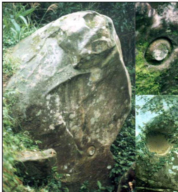
陽石(左)及其同心圓(右上)和陰石同心圓(右下)。