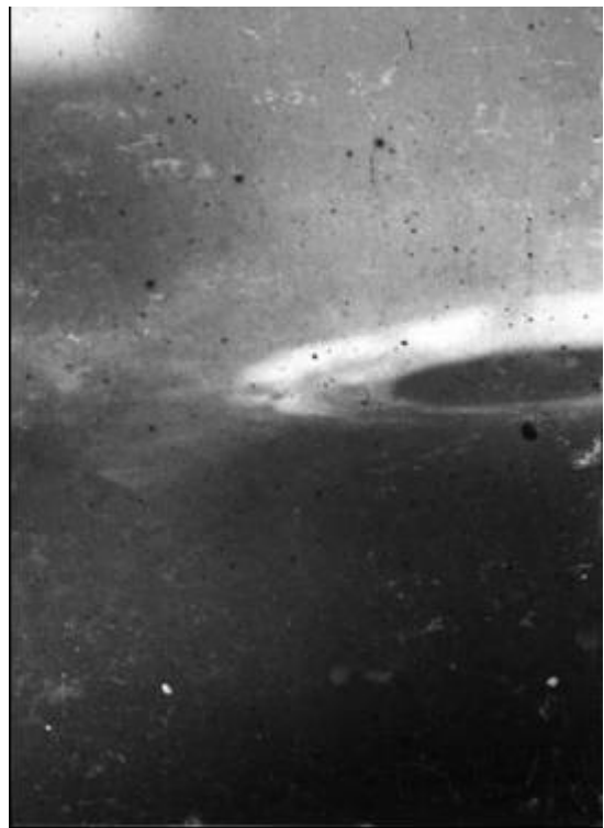
1967年6月28日蔡章鴻所拍攝幽浮照片

「十日並出」，記載在《古今圖書集成》。古代神話「后羿射日」就是根據這則記載演變而來的。這裡的「十日」，並非神話所說的十個太陽，根據飛碟學的看法，應該是十個像太陽那麼大而會發光的飛行物體一起出現。其後在夏帝桀及商帝辛時，同樣有「三日並出」及「二日並出」的記載；在西漢昭帝時，記載「有流星大如月，眾星皆隨西行」等等，這些日、月及星等，顯然就是現代人有所知悉的「幽浮」。迄今，我國正史中的幽浮紀錄約有一千件。另有一些坊間流通的書畫，也有這類記載，就如清末民初上海「申報」出版的畫刊《點石齋畫報》，有一則「赤燄騰空」，記述某晚在南京(金陵)天空出現一團火球，圖文並茂。因此若要研究幽浮史，應從我國正史中的史籍開始。