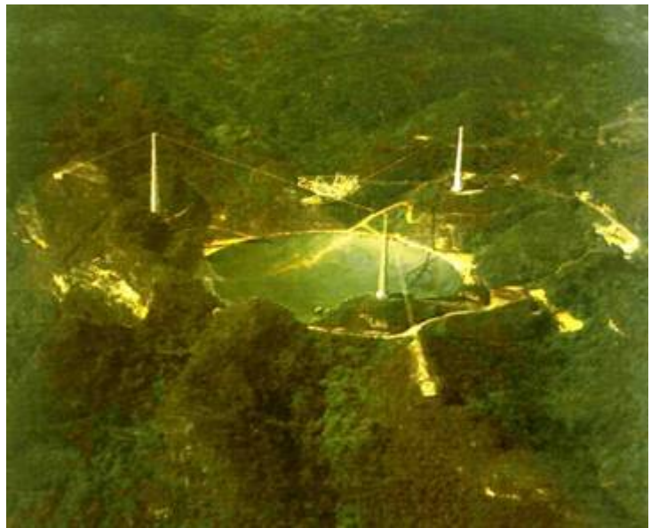
波多黎各直徑305M世界最大無線電望眼鏡

根據狹義相對論，並已經證實高速運動中的物體，其時間的歷程會延遲。因此若飛碟以接近光速的速度飛行，遠從四一 0 光年的昴宿星到達地球僅需約六年半而已；遠在二三 0 萬光年的仙女座星，也僅要約十五年即可到達地球。若外星人的科技已發展出這種速度的飛碟，這是可能的清況之一。但是物體的速度 a 達