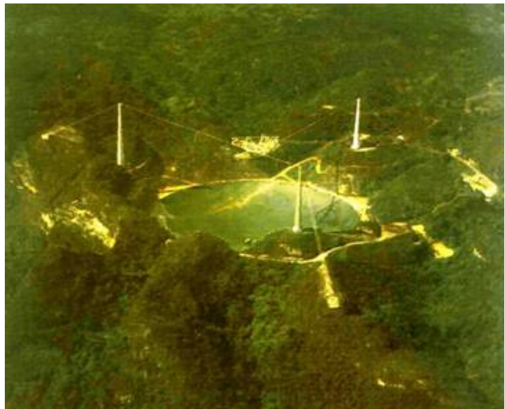
波多黎各直徑305M世界最大無線電望眼鏡

根據狹義相對論，並已經證實高速運動中的物體，其時間的歷程會延遲。因此若飛碟以接近光速的速度飛行，遠從四一 0 光年的昴宿星到達地球僅需約六年半而已；遠在二三 0 萬光年的仙女座星，也僅要約十五年即可到達地球。若外星人的科技已發展出這種速度的飛碟，這是可能的清況之一。但是物體的速度 a 達