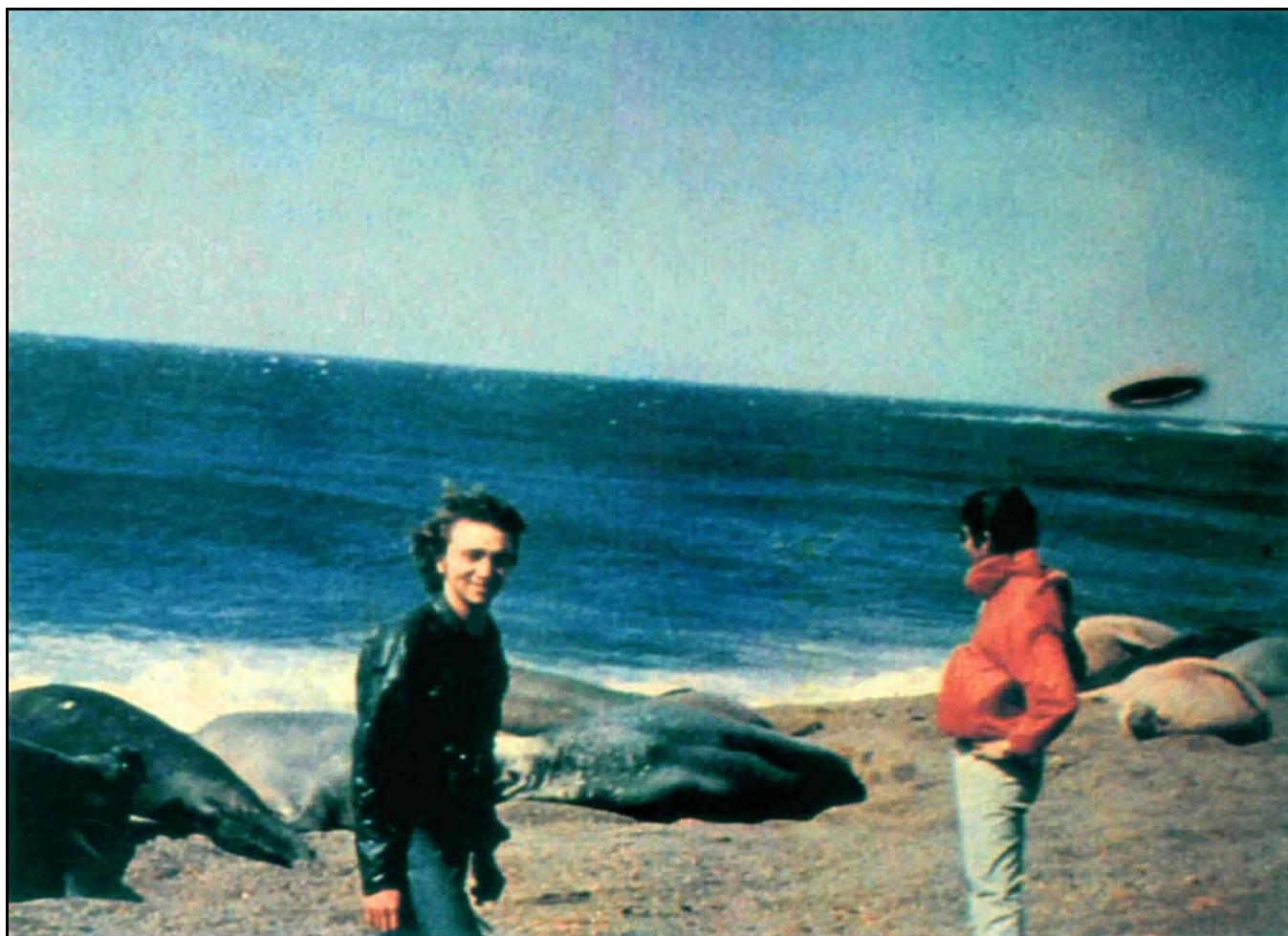
在阿根廷的海灣幽浮從海底飛出。