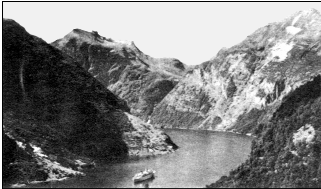
挪威蓋蘭蓋峽灣的兩邊峭壁間大船能進入相當深奧的水域

息：「有國籍不明的潛水艇潛在峽灣裡。」為了搜查這個潛水艇的來歷及目的，於是命令海軍艦船三十多艘出動搜尋，並且包括美國和英國的北大西洋公約組織(NATO)一部分艦船也參加這次的行動，使得規模更加廣大。