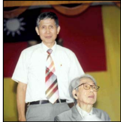
座談會上作者與國分直一（右）合照。

一九九九年五月十三日國分直一在台南縣佳里鎮北門高中舉行座談會的談話中，國分直一教授根據他考古研究結果，宣稱台灣原住民的獵人頭風俗，在舊石器時代根本不存在，而是到新石器時代，需要土地耕作，為阻止外人侵佔，始有獵人頭的風俗。原住民的居住和耕作的土地，若受異族侵入及掠奪的話，被認為是比死更嚴重的屈辱。因此，他們必拚死防衛，不容許外力的侵佔。由此可知，台灣的原住民，並不是天生野蠻人，更不是食人族，而是受到外人的侵入才起而防衛，因而被誤為原始野蠻人，實在是外人對原住民認識不深所致。（第五章結束）