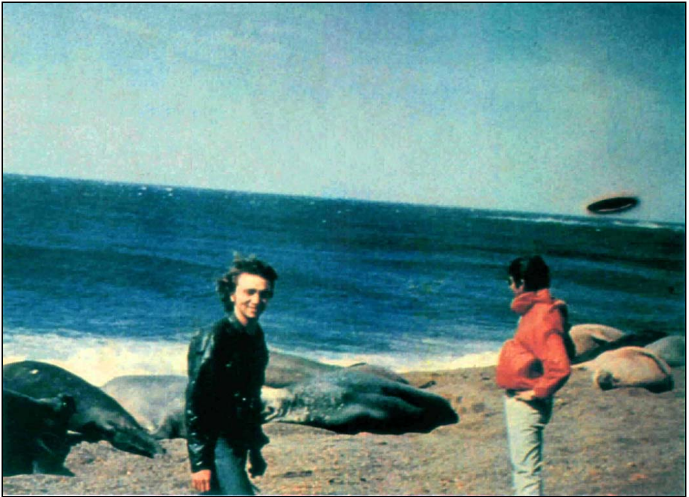
在阿根廷的海灣幽浮從海底飛出 。