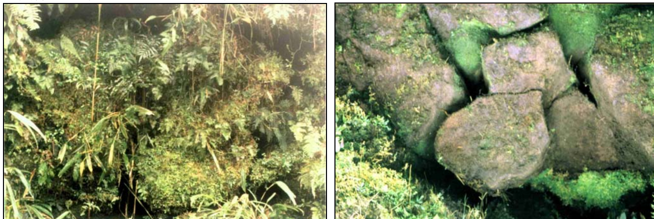
金字塔砌石覆蓋物，清理前(左)與清理後(右)，可知有人為堆砌而成的跡象。

們仔細觀察後，發現金字塔一部分有植物和薄層的沙土覆蓋的坡面，被風雨侵蝕成些微凹凸不平，卻具有規則狀。經清理覆蓋物後，可以看到坡面是一塊塊岩石經人為堆砌而成的原貌，由此可以發現金字塔土丘部分是在火山圓錐體上，增加許多石塊疊砌起來，而且把坡面凹陷的部分填補成完整的三角錐體。因此，可以看出先民是利用現有的火山圓錐地形，向外堆砌石塊伸展構築成為三角錐的金字塔(埃及、馬雅金字塔為四角錐)。