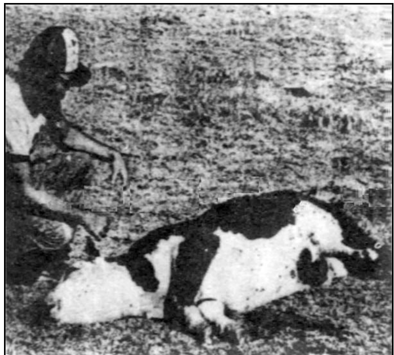
公牛被吸乾血液，剷取直腸、性器。

然而，現場是硬的像石頭一樣的地面，一般的重物根本不可能壓出這樣的坑洞來，除非是用挖土機來挖，可是在地面上又看不到任何移動或搬運的痕跡。因此，有人推測它有可能是從天而降的，除此之外，找不到任何蛛絲馬跡。