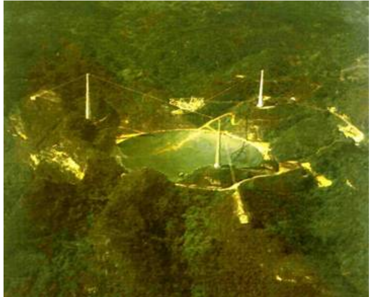
波多黎各直徑305M世界最大無線電望眼鏡

根據狹義相對論，並已經證實高速運動中的物體，其時間的歷程會延遲。因此若飛碟以接近光速的速度飛行，遠從四一〇光年的昴宿星到達地球僅需約六年半而已；遠在二三〇萬光年的仙女座星，也僅要約十五年即可到達地球。若外星人的科技已發展出這種速度的飛碟，這是可能的清況之一。但是物體的速度 a 達到光速時，其質量 m 會變成無限大，則根據物理學： f = ma ，所需