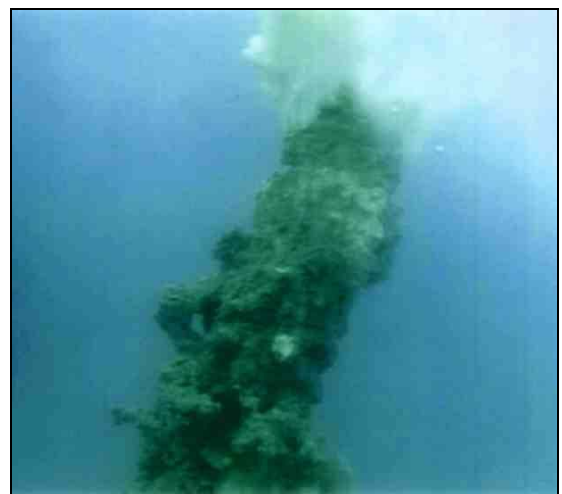
龜山島附近海域有直徑四公尺海底熱泉大噴口。