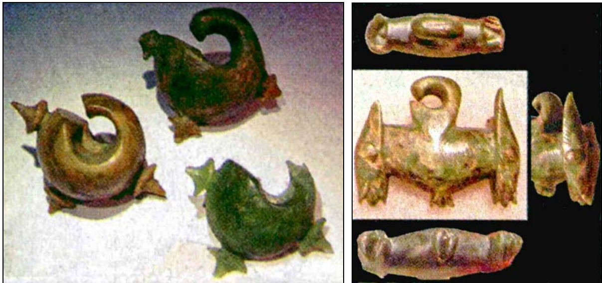
(左)越南與菲律賓出土，距台二千多年前的玉耳環，都是以台灣玉製造的（存於越南考古所及菲律賓國家博物館）。(右)台灣、菲律賓之間的巴丹群島也有發現台灣玉器（存於菲律賓國家博物館）。

該研究讓世人更了解東南亞五千年前的海上貿易形式，到目前為止，全世界所發現涵蓋地理區最廣的史前海上貿易活動，也間接證實過去許多語言學者及考古學者提出「台灣是東南亞、太平洋地區南島語族起源地」的理論。南島語族範圍東起南美洲西岸的復活節島，西到非洲東岸的馬達加斯加島，北至夏威夷，南達紐西蘭，涵蓋太平洋和印度洋區域。