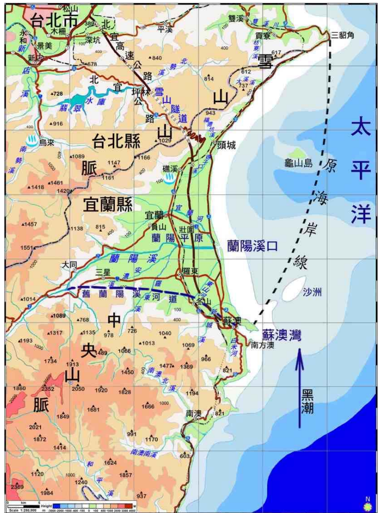
台灣東北角附近地形圖

2001年4月底，國際共同參與的海洋鑽探船「聯合果敢號」在台灣東北海域進行海洋鑽探計畫(ODP)1202站的作業。在龜山島東方約75公里處的南沖繩海槽南坡，即宜蘭海脊北坡、水深1,275公尺處，鑽取四口岩心，其中最深一口深入海底地層410公尺。由鑽取的岩心，氧同位素研究綜合紀錄中，其沉積率估算約為每千年500公分(1)，一般海底沉積率平均才有3-5公分而已，我們可以