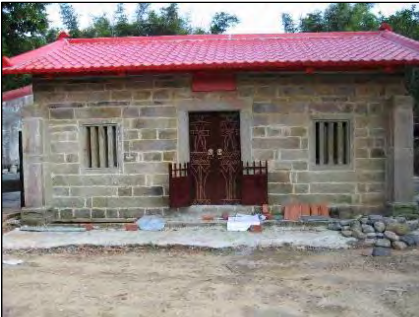
凱達格蘭族祠堂正面

台灣北部是屬於平埔族凱達格蘭族的範圍，根據大部分北部平埔族口承傳說的歷史，他們發源於台灣北部。「凱達」一詞為原住民祖先的聖名，他們來自南方綠椰之地——「山那賽(Sanasai 或 Sanasay)」，在北台灣登陸，登臨三座主要山系：(一)、台北七星山；(二)、瑞芳雞籠山(基隆山)；(三)、貢寮荖蘭山(又稱卯里山；今被佛教徒稱為「靈鷲山」)；這三座原名都稱為「荖蘭山」。建構北台灣三處聚落，命名為「龜霧社」，繁衍族群，然後以山系稜線向東、西、南擴散。