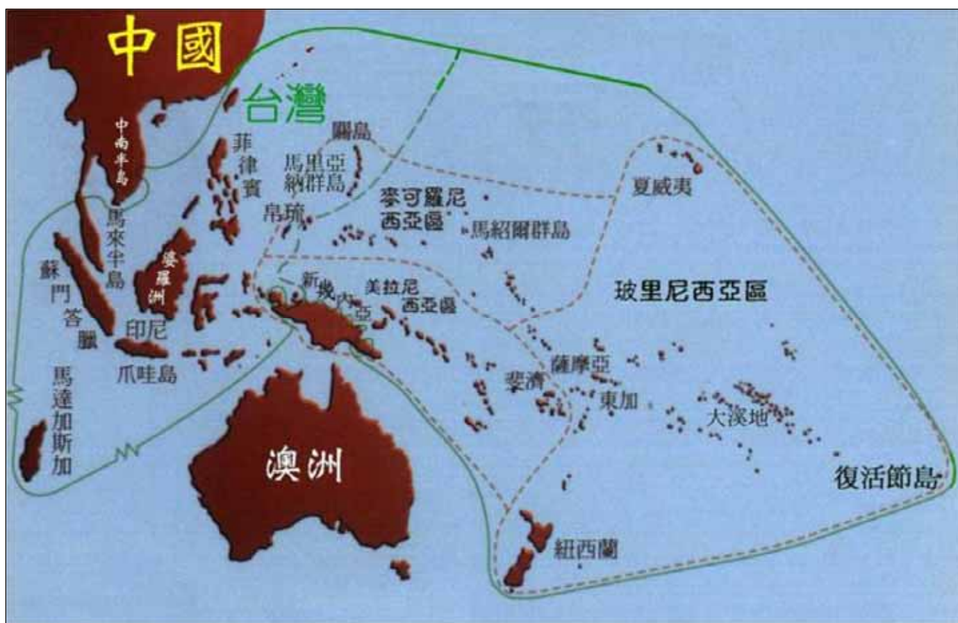
南島語族民族分佈圖

文章(The Austronesian homeland: A linguistic perspective)，認為南島民族的起源地應該是在台灣，由台灣開始擴散的。另一位考古學家貝爾悟德(Peter Bellwood)，他在一九九一年的七月發表了一篇文章，完全採用這個看法。他推論距今約五千年，南島語族從台灣開始逐島遷移，在數個世紀中經菲律賓、婆羅州(Borneo)、西里伯斯(Celebes)、爪哇(Java)、帝汶(Timor)、馬里亞納群島(Mariana Islands)、蘇門答臘(Sumatra)、新幾內亞、斐濟、東加(Tonga)、密克羅尼西亞、玻里尼西亞、夏威夷、印尼、復活節島、馬達加斯加等島，最後到紐西蘭。一九九五年，史塔羅斯塔(Starosta)更明確指出台南平原就是擴散中心。目前這些學說已被大多數學者所採信。