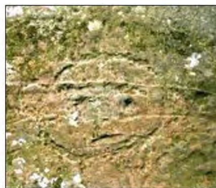
孤巴察峨人面岩雕