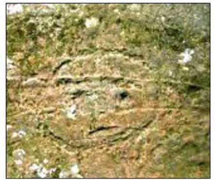
孤巴察峨人面岩雕