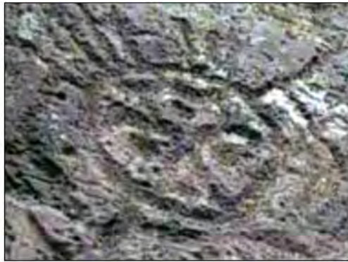
孤巴察峨人面岩雕