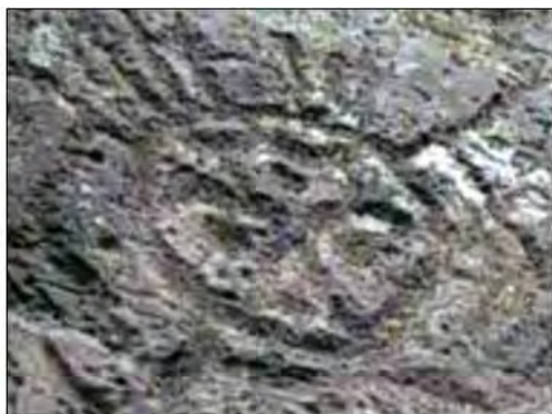
孤巴察峨人面岩雕