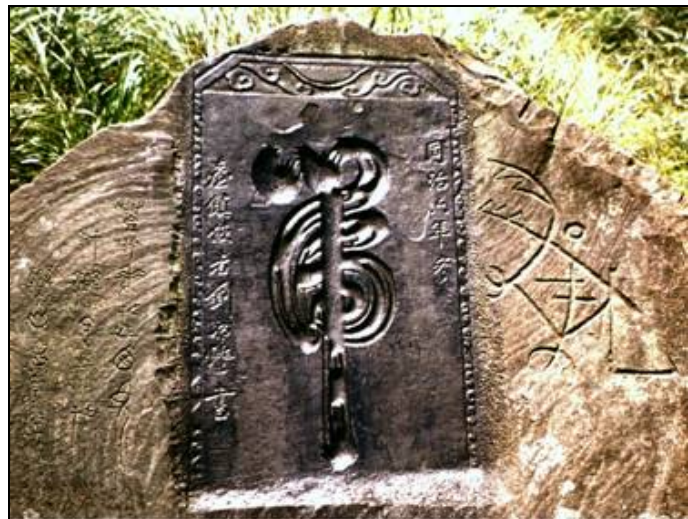
台灣貢寮草嶺古道虎字碑

根據海洋學的海底調查結果，琉球古陸沉沒的年代和喬治瓦特所說姆大陸淹沒的時間吻合，可說琉球古陸確實經歷太陽帝國的時代。近代在琉球的沖繩本島發現