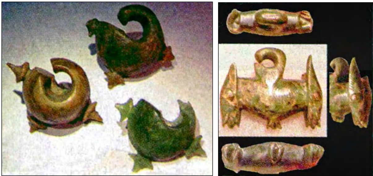
(左)越南與菲律賓出土，距台二千多年前的玉耳環，都是以台灣玉製造的（存於越南考古所及菲律賓國家博物館）。(右)台灣、菲律賓之間的巴丹群島也有發現台灣玉器（存於菲律賓國家博物館）。

該研究讓世人更了解東南亞五千年前的海上貿易形式，到目前為止，全世界所發現涵蓋地理區最廣的史前海上貿易活動，也間接證實過去許多語言學者及考古學者提出「台灣是東南亞、太平洋地區南島語族起源地」的理論。南島語族範圍東起南美洲西岸的復活節島，西到非洲東岸的馬達加斯加島，北至夏威夷，南達紐西蘭，涵蓋太平洋和印度洋區域。