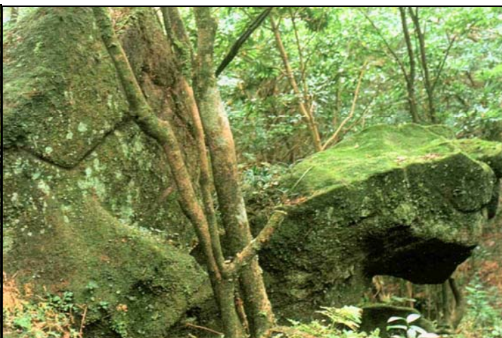
台北七星山人工雕刻的龜石