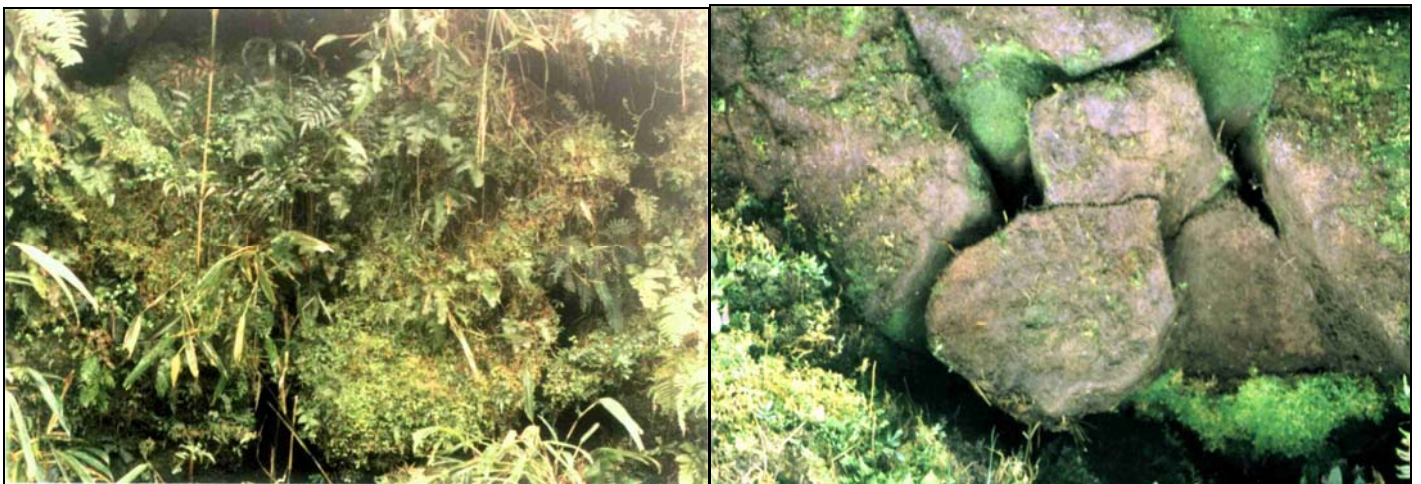
金字塔砌石本體覆蓋物清理前(左)與清理後(右)比較

經作者親自現場觀察，對於在七星山主峰群之間、呈三角錐狀的陡峭山丘，外表一部分可以看出是整塊天然岩壁，但另有一部分有植物和薄層的沙土覆蓋，已被風雨侵蝕成凹凸不平，卻具有規則狀，經清理覆蓋物後，可以看到一塊塊岩石的本貌。由此可以發現土丘部分是由許多岩石疊砌起來，把山丘較凹陷的部分補成完整三角錐狀的金字塔。因此可以看出，先民是利用現有的山丘地形，構築成為三角錐狀的金字塔，並且由其高出基面約二十公尺的覆草顏色與周圍也不同。因此我們可以確認七星山金字塔是由自然陡峭錐體，加上人造構築而成的，也就是古代的巨石文化(Megalith)遺跡。