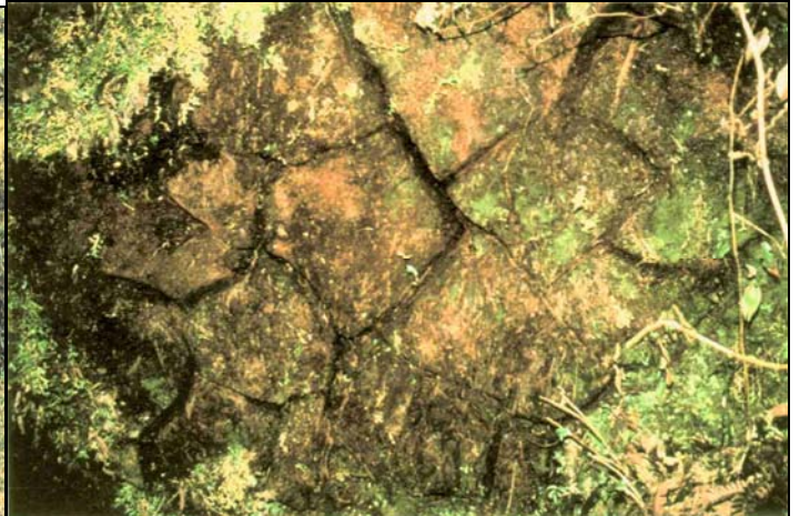
七星山金字塔北後方石塊堆砌而成的祭天壇