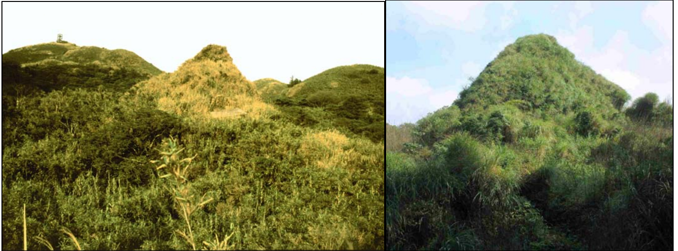
台北七星山金字塔南向(左)和北向(右)。

近年在台北七星山發現的金字塔，曾被學術界存疑，最近已有地質學家確認是人造物。這座海拔一〇四〇公尺的金字塔山丘，位於七星山北(主)峰、西峰及東峰交界處的平台，和七星山主峰、紗帽山構成一條南北向地軸線。金字塔就在這個地軸線和東、西峰連線的交點上，是台灣原住民凱達格蘭族的聖地。