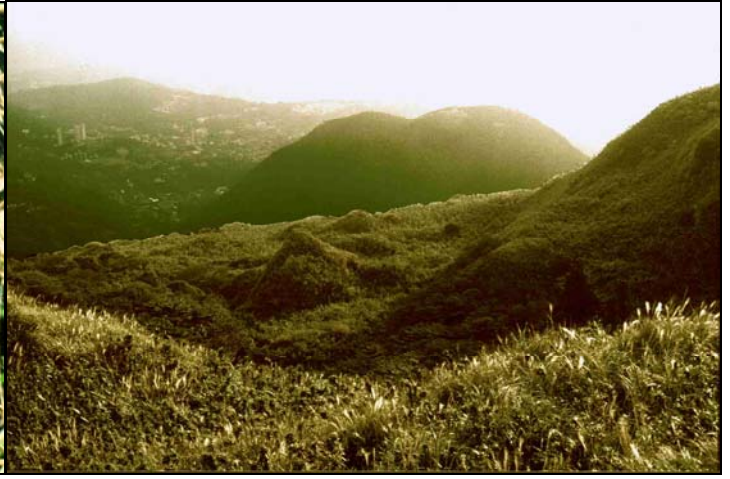
七星山金字塔底部疊石已被風化成無稜角石塊 七星山金字塔(中)與巨石堆、紗帽山凹成地軸線

在金字塔三角錐的底部有一部分由石塊疊成，今已被風化浸蝕成為無稜角的石堆，可見金字塔建造的年代一定非常久遠。在金字塔頂點對準紗帽山的中央凹槽的南北向地軸線上，有一堆呈三角形人工堆疊的巨石堆，其三角頂也在南北地軸線上成直線排列。