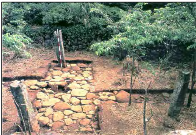
大屯社遺址砂岩立柱是干欄屋的基石

在六千年前，原住民陸續從台灣擴散到南洋時，南島語族居民就把台灣干欄屋建築模式帶去。由於石柱不易取得，只得就地取材，基石改用木樁或竹樁，改造為所謂「長屋(Long House)」。一些原住民大夥居住在長屋，那是一種竹木結構的高腳屋，其結構就是根據「干欄屋」的構想而建造的。每座長屋都由高架木樁或竹樁支撐著，上面住人，下面就豢養家禽牲畜，可以容納數十人的大家庭，甚至大家族，以免受山洪暴發和齧齒動物的危害，成為現在南洋的原住民大夥居住的處所。