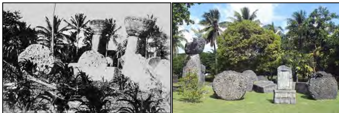
北馬里亞納天寧島傾斜及倒下的塔加屋基石——拉提石柱

在北馬里亞納的天寧島(Tinian)也有古代塔加屋的基石——拉提石柱，主要材料是長達六公尺的十二根方形巨大石柱。這些拉提石柱是由巨大堅硬的石灰石和珊瑚礁石合成；石灰岩巨型柱子側面呈梯形，每一塊珊瑚礁石都類似一個實心的大碗公，只不過這個碗高約三公尺。站在這根巨柱旁邊，人顯得異常渺小，也能讓看到的人歎為觀止，感歎它當初的宏偉。此外，還有散布著許多成謎的巨石文明遺跡，例如：同屬北馬里亞納的喜納珊島(Hinapsan)有拉提石柱、塞班島(Saipan)有阿吉幹(Agingan)拉提石柱群，這些與天寧島塔加屋有兩排的巨石柱相似。