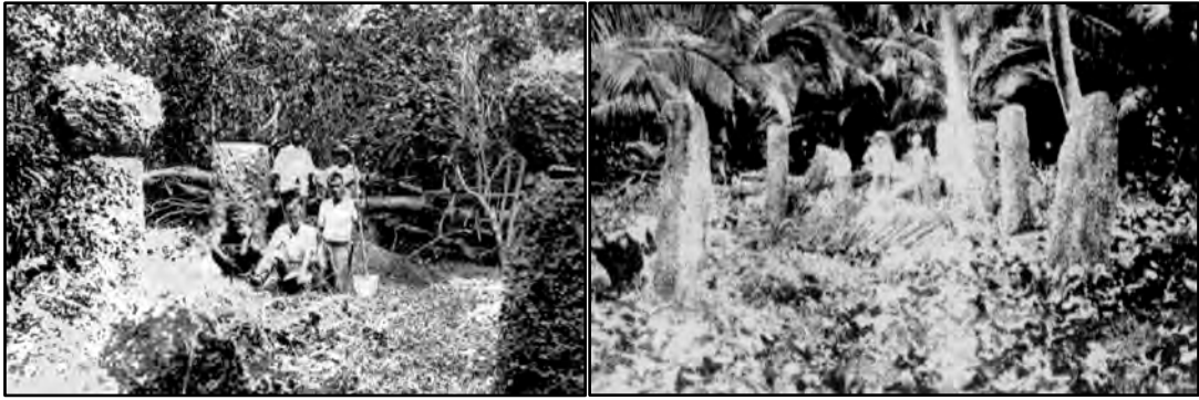
北馬里亞納群島喜納珊島拉提石柱