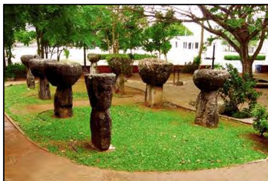
關島拉提石公園有八根拉提石柱

距離台灣最近的大洋洲密克羅尼西亞群島中的關島(Guam)，其行政大廈正對面的拉提石(Latte Stone)公園，豎立著八根古代建築遺跡——「拉提石」。這些拉提石，或稱「拉提石柱(Latte Pillar)」，是從關島南部的美波(Mepo)地區遷移過來，重組而成的。這八根石柱平均高為 2.5 公尺。分成兩列相對並排。據考古學者的研究認為，關島拉提石巨型石柱是原住民族在海邊建築「塔加屋(House of Taga)」，或稱「高腳屋」使用的基石。這是萬餘年以前，南洋一帶原住民大夥的住屋。拉提石由下半部稱為海利基(Haligi)的石灰石柱和上半部稱為塔沙(Tasa)的珊瑚礁石帽組合而成，然後在上面高架起木梁為支架，鋪設樓板，抬高樓板面，再用木頭或竹子當做屋樑，並在其屋頂用茅草或樹葉覆蓋住，建造成懸空的「塔加屋」。拉提石柱的半圓形石帽與方形石柱一凸一凹密合，即所謂卡榫，與台灣基隆已崩壞的老鷹石石榫作用相同，有避震的功能。拉提石柱的高度象徵著居民的身分地位，石柱越高的就代表地位越高。與同屬密克羅尼西亞的卡羅林群島帛琉(Palau)大島巴貝爾道島(Babeldaub)和科羅爾島(Koror)也發現拉提石柱。在帛琉的大島緊臨海岸線的平坦空地，有多處巨大的石柱遺跡，共有三十三根，其中有十餘根黑色的方形柱狀石頭排成兩列或三列，稱為黑魔石，有的石柱會雕成有著大圓眼睛的人面，稱為人面石，這些都是塔加屋的基石，只是構造稍異。