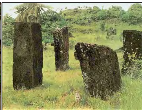
帛琉大島拉提石柱——黑魔石