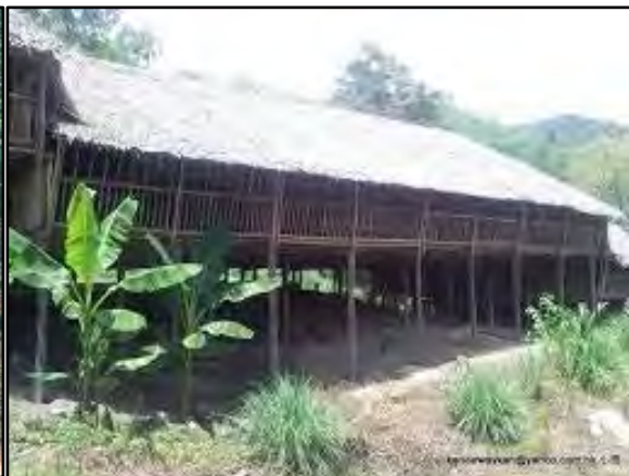
南洋的原住民大夥居住的「長屋」