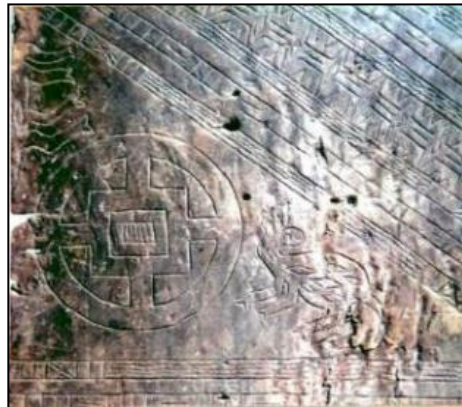
凱達格蘭族的古木雕