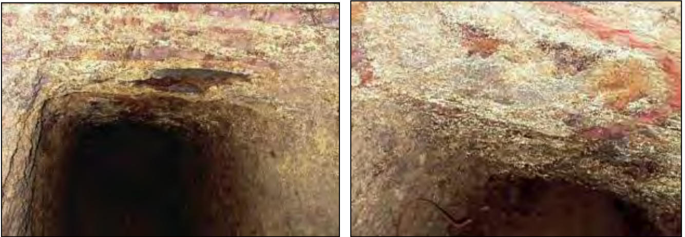
圖 4.27 核四廠區第一號地洞和第二號地洞內壁

舊香蘭遺址位於台東縣太麻里海邊，面積大約二十公頃，距今一千九百年至二千二百年。台東舊香蘭遺址有史前時代的金屬工業，包括黃金加工業。從遺址文化層土方中篩洗出黃金殘留，包括四件厚約 0.12 毫米的金箔、一件直徑 0.37 毫米的小金片及一件直徑約 2 毫米的小金珠，另外還有多件陶土夾雜碎金。舊香蘭遺址發現鑲在陶土的黃金珠(圖 4.28)，證明距今一千九百年前的史前人類已有黃金加工技術，冶煉黃金，並且有能力將溶解溫度提高到攝氏一千兩百度，這也是台灣發現的冶煉黃金技術。由此黃金加工技術冶煉黃金，可以推論台灣是人人嚮往的黃金島。