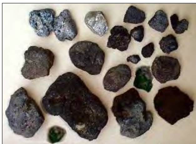
圖 4.24 深黑色浮石