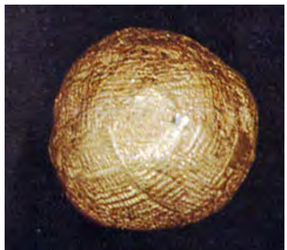
圖 4.28 台東舊香蘭遺址發現鑲在陶土的黃金珠

舊香蘭遺址位於台東縣太麻里海邊，面積大約二十公頃，距今一千九百年至二千二百年。台東舊香蘭遺址有史前時代的金屬工業，包括黃金加工業。從遺址文化層土方中篩洗出黃金殘留，包括四件厚約 0.12 毫米的金箔、一件直徑 0.37 毫米的小金片及一件直徑約 2 毫米的小金珠，另外還有多件陶土夾雜碎金。舊香蘭遺址發現鑲在陶土的黃金珠(圖 4.28)，證明距今一千九百年前的史前人類已有黃金加工技術，冶煉黃金，並且有能力將溶解溫度提高到攝氏一千兩百度，這也是台灣發現的冶煉黃金技術。由此黃金加工技術冶煉黃金，可以推論台灣是人人嚮往的黃金島。