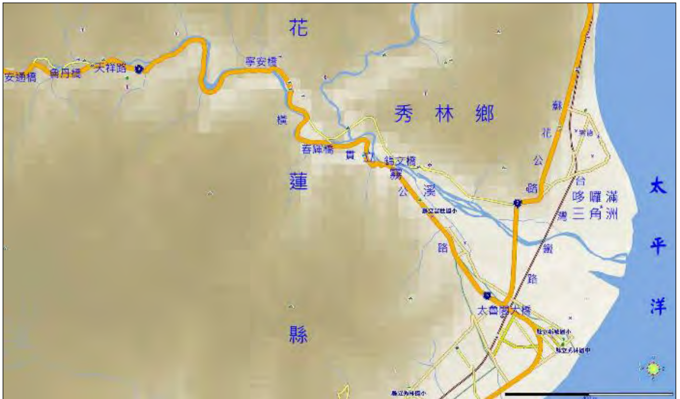
圖 10.33 淘金勝地得其黎三角洲地圖

長久以來，崇德海灘就是非常熱鬧的淘金樂園，經常都有來自外洋不知國籍的帆船長期駐紮海灘淘金，也伺機和深山原住民交易沙金。根據崇德村得其黎社長老說，大概在一百四十年前，因為原住民與外國淘金客起糾紛而衝突，大動干戈，死傷無數。