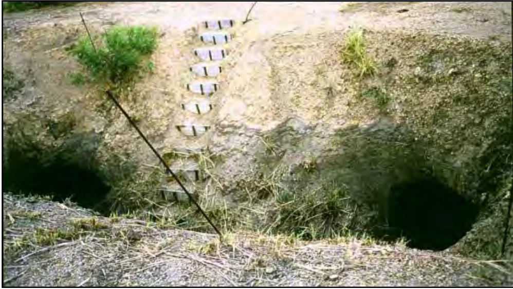
圖 4.26 鹽寮遺址核四廠區番仔山第 1、2 號地洞外貌