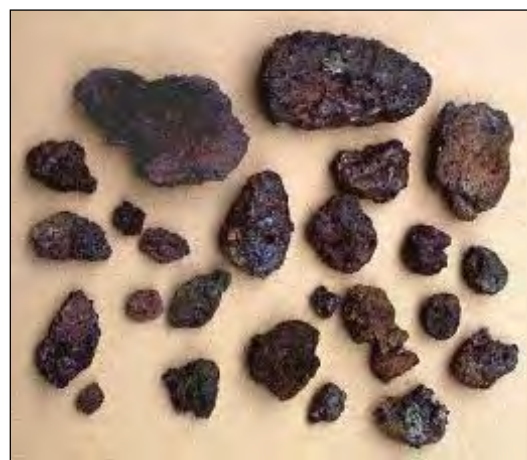
圖 4.25 古銅色浮石

貢寮鹽寮灣番仔山核四廠區有三條原來相通的地洞(圖 4.26)，第一、二號地洞在洞內壁上，滿佈金光閃閃的金屬物質(圖 4.27)、可能是在冶煉金屬時，煙含金屬，附著於洞壁的，歷久彌新。第三號地洞已被砂土堵住，無法入內探視。