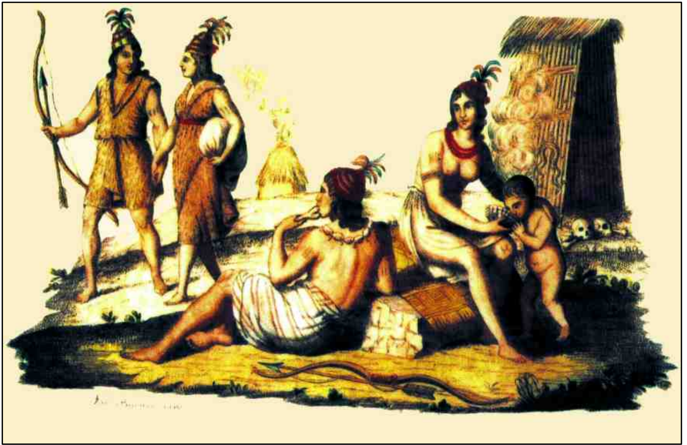
西班牙人所繪高貴的平埔族凱達格蘭人

九成為本島人，怎麼可以說台灣人就是中國人？一直到現在，台灣政府還是沒有釐清這種事實，甚至在國際上也造成誤解。有些研究者對台灣的研究，認為台灣的平埔族就是中國的漢人，台灣的原住民只有高山族，導致研究台灣原住民來源的結果發生偏差。