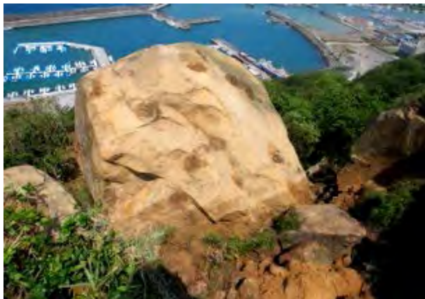
傾斜後的老鷹石軀幹巨石塊有石樵痕跡