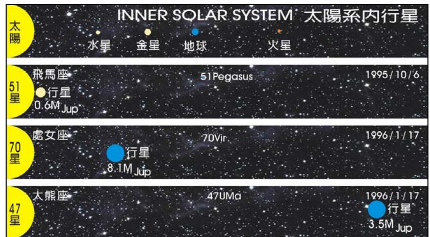
圖為天文學家馬希與巴特勒發現兩顆環境適合生命存在的新行星，他們所製作的四大行星系圖，由上而下分別是地球所屬的太陽系，飛馬座五十一號恆星及其行星，處女座七十號恆星及新發現行星，與大熊座四十七號恆星與新行星。

一九九六年一月十七日在「美國天文學會」年度會議上，美國舊金山州立大學天文學家馬希表示，他與同僚華盛頓卡內基學會的天文學家巴特勒在經過八年搜尋後，發現兩顆距離地球三十五光年的行星，當地環境具有讓液態水與其他維持生命條件存在的特質，意即可能適合生命滋長的新行星。