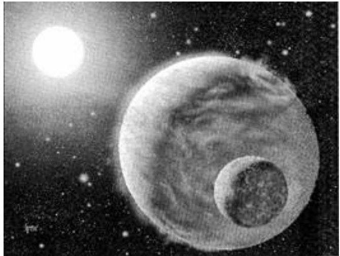
圖為畫家筆下「千禧行星」(圖中)的外貌。英國科學家利用加那利群島的望遠鏡，看到這顆新行星的光。圖左為「千禧行星」的母星牧夫座 \tau 星。

二〇〇〇年三月三十日美國科學家宣布，首次發現太陽系以外有一些體積和土星差不多的小體積行星。在環繞類似太陽的星體的軌道上運行，此一發現使人類發現和地球差不多大小行星的機會大增。他們利用地球上最巨型的望遠鏡以及改良過的搜尋技術，發現在距離地球一百多光年以外，有兩顆環繞不同恆星運行的行星，這兩顆行星的軌道和兩顆星體非常接近，因此溫度極高，不太可能有生命和水。在此之前，科學家在太陽系以外發現了約卅顆行星，這些行星的體積和太陽系最大的行星木星差不多或更大。科學家質疑，這些是否為真正的行星。