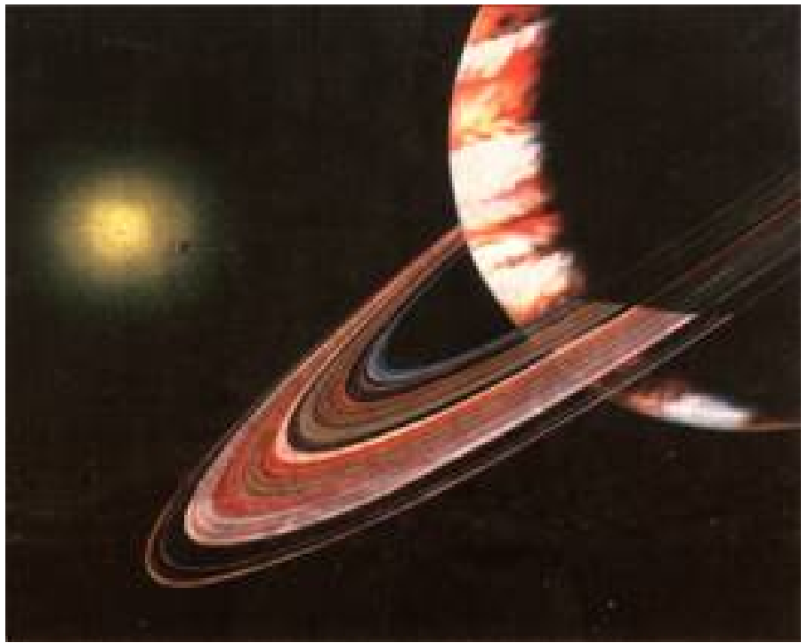
藝術家筆下的 \upsilon 仙女星和它的三顆行星，黃色發光體為 \upsilon 仙女星。

美國大氣研究中心、澳洲的英澳天文台及美國哈佛大學與舊金山大學等研究人員研究太陽系外行星並獲得許多成果。費雪和同事從一九八七年起開始積極找尋「外太陽系行星」，迄一九九九年四月起碼就已找到二十幾顆太陽系外的行星，有十四顆就是他們的研究成果。其中即包括一九九六年發現環「仙女座第二十號星 \upsilon 」三顆行星中的最內環星，質量至少是木星的四分之三，而且非常接近它的恆星，每四點六天繞行一周。